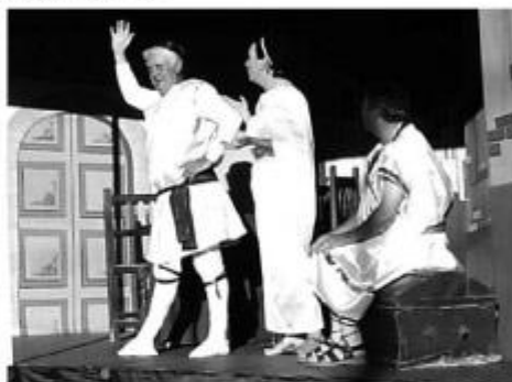
La Olla, de Plauto

Sanz en Nueva Alcarria (23 agosto 2006), al hacer la crítica de La olla , de Plauto: «Muchas compañías profesionales, aunque dotadas de más medios, podrían aprender del buen hacer de estos actores labreños: aficionados dedicados en la vida ordinaria a mil oficios diversos, pero amantes del teatro, que saben salir airoso al inmolarse, como las fallas, en un única representación». La crónica, titulada «Labros disfruta del teatro», recordaba esta larga tradición, «con obras bien seleccionadas, con un tono de sátira que trasciende épocas y lugares, con lenguaje ameno y divertido». Y resumía: «Como siempre, cita obligada, que labreños y molineses de los pueblos del entorno no suelen perderse».