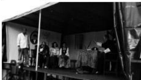
El juez de SorbaL, en 2004