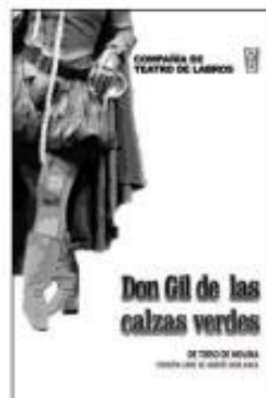
Don Gil de las calzas verdes

La comedia de Tirso de Molina se añade así a las ofrecidas los últimos años, como El enfermo imaginario , de Molière, o La olla de Plauto , que en 2006 alcanzó también un rotundo éxito. Sobre esta antigua tradición del teatro en Labros se puede leer un reportaje en la última página.