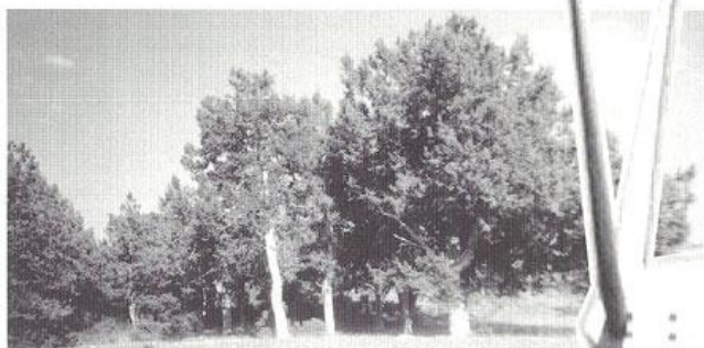
Sabinas de Labros, en julio de 2002.

El daño sería muy sensible sobre uno de los pocos sabinas que quedan en Europa. La propia Junta había declarado a la sabina en 1987 «especie protegida y de interés especial», y ahora el estudio obligatorio que presenta la empresa que trata de arrasar Labros vuelve a reconocer que los más